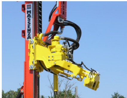
Braccio carica aste Rods loading arm Bras de chargement de tiges Brazo de carga barras Bohrrohr handling system Автоподатчик штанг