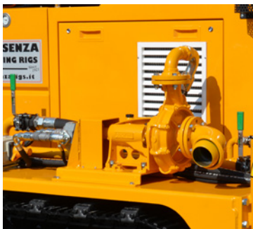
Pompa fango Mud pump Pompe à boue Spülpumpe Bomba de lodo Грязевой насос