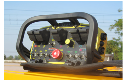
Radiocomando Radio remote control Télécommande Mando a distancia Fernbedienung Пульт радиоуправления