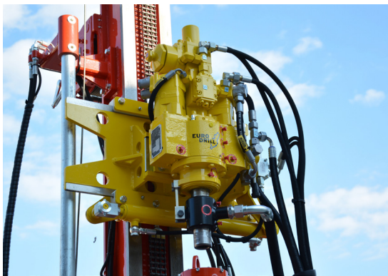
Testa roto-percussione Hydraulic drifter Tête roto percusion Hydraulikhammer Cabeza con martillo hidráulico Гидромолот