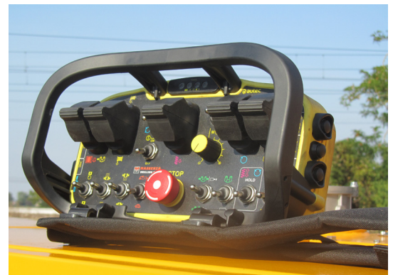
Radiocomando Radio remote control Télécommande Mando a distancia Fernbedienung Пульт радиоуправления