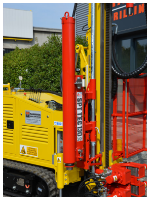
Penetrometro SPT SPT penetrometer Pénétrömètre SPT SPT penetrationsmesser Penetrometro SPT Пенетрометр SPT